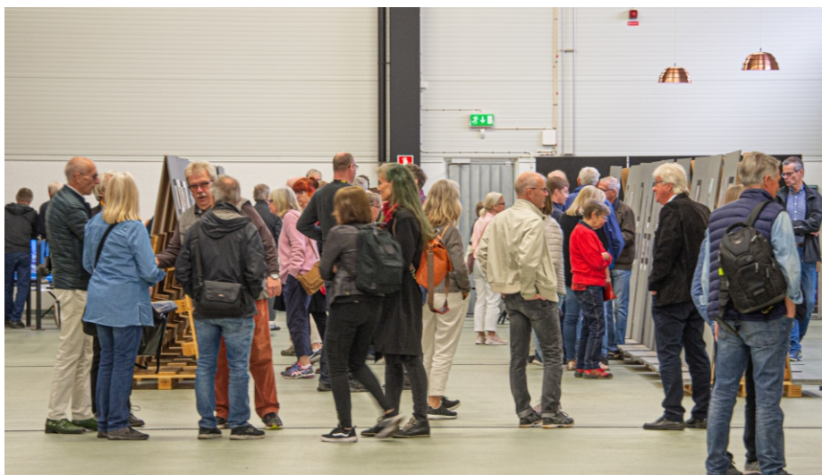
En annan sponsor var Gärsnäs Bil, som marknadsför Mazda och Mitsubishi på Österlen och dessutom är en av de mest framgångsrika i landet på just detta. De visade upp fordon utanför utställningshallen. Det enda tryckeriet på Österlen, Åbergs Tryckeri i Tomelilla, sponsrade evenemanget med olika trycksaker; inte minst tryck på tröjor.