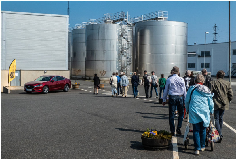
En kort promenad mellan restaurangen och utställningen i Ekfatshallen.