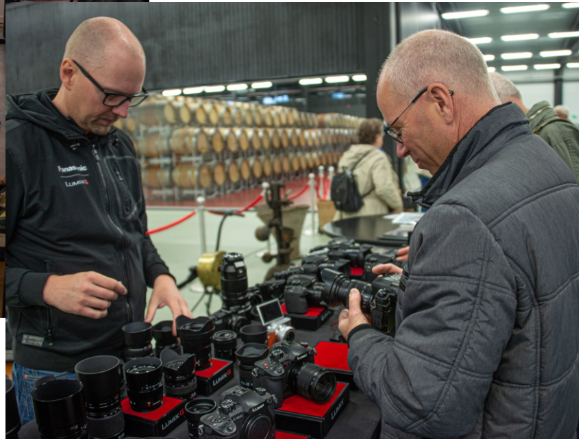
På sponsorsidan märktes bl a Mattssons Foto i Lund, som är en av landets äldsta och mest välsorterade fotoaffärer. De finns på samma plats sedan 1921. Hit kan man komma och titta och känna på det mesta i fotoväg.