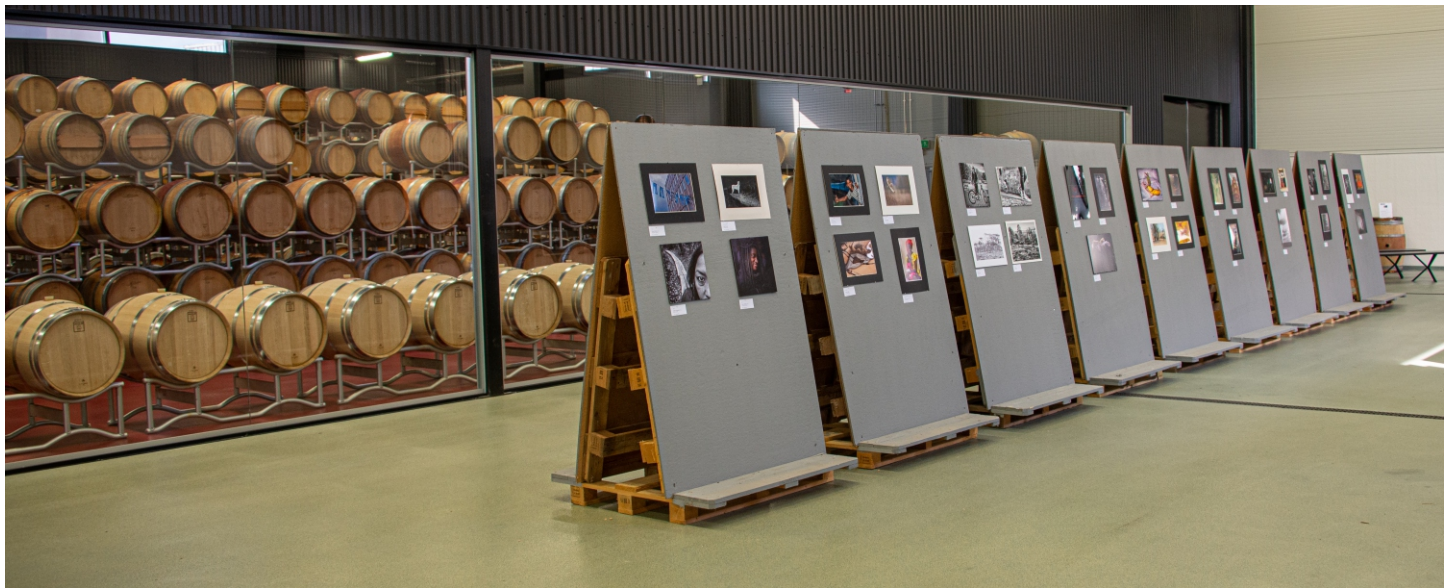
Lite udda och inspirerande miljö med hundratals vintunnor som bakgrund.