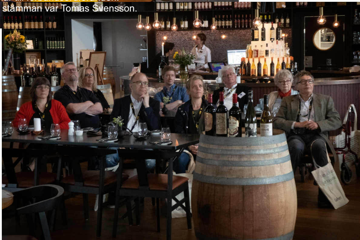
Vi hoppas ni trivdes på Österlen och återvänder hit fler gånger.