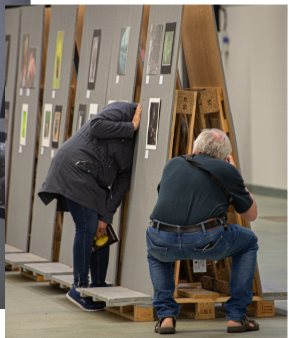
Lite fantasi skapar många fotomöjligheter.