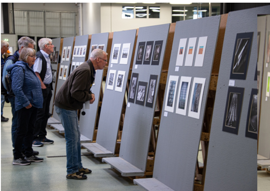
Fotoutställning som tål att närskådas.