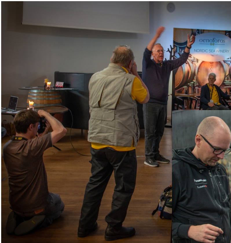
Folkare Fotoklubb i Avesta hälsar välkomna till nästa års riksfototräff.