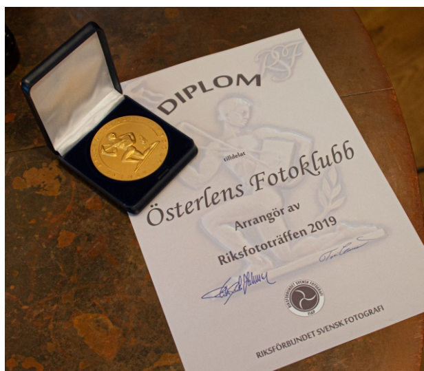
Alla vi i Österlens Fotoklubb har nu pustat ut och tackar för oss och ser fram emot nästa års riksfototräff.